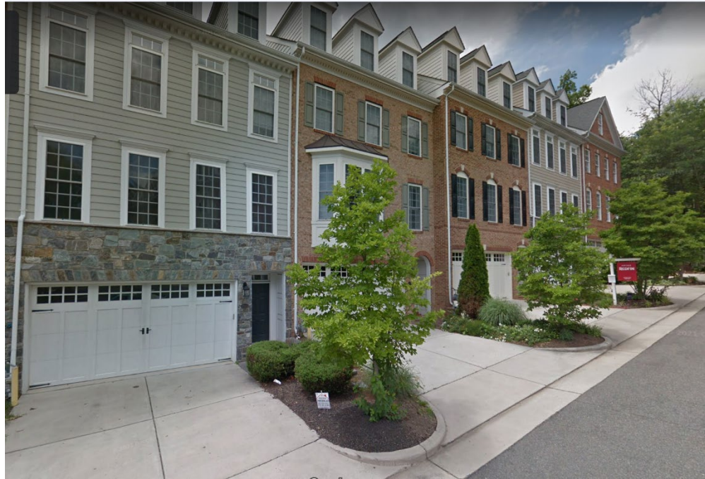
Casas adosadas en Goddard Way en Alexandria

Las casas adosadas han sido un tipo de vivienda popular a lo largo de la historia de Alexandria. La ordenanza de zonificación de Alexandria permite casas adosadas en múltiples zonas, pero las reglas pueden ser muy diferentes dependiendo de la zona. Esta iniciativa tratará de crear un conjunto común de normas para el desarrollo de casas adosadas y reducir las barreras normativas innecesarias para la construcción de casas adosadas dentro de zonas comerciales.