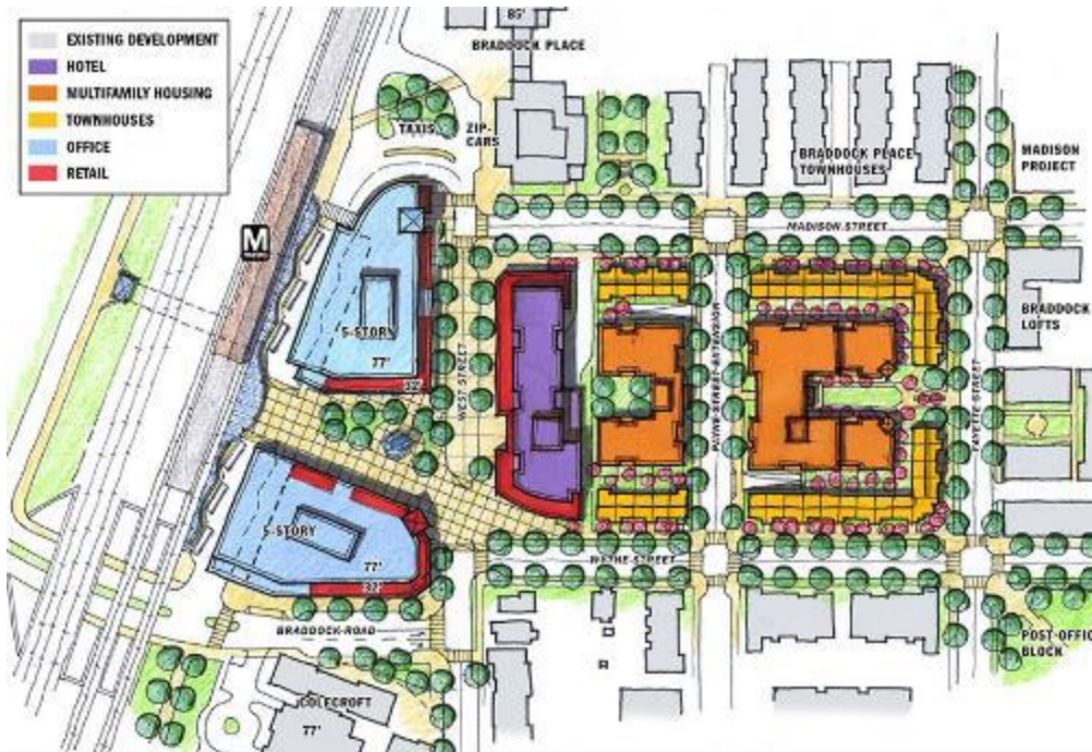
Ilustración del metro de Braddock Plan del vecindario

Esta iniciativa revisará las densidades permitidas existentes dentro de los espacios reducidos de las estaciones de metro y las estaciones de BRT existentes y planificadas. Analizaría en mayor profundidad cualquier barrera existente actualmente en vigor que limite el aumento de densidades alrededor de las estaciones de tránsito.