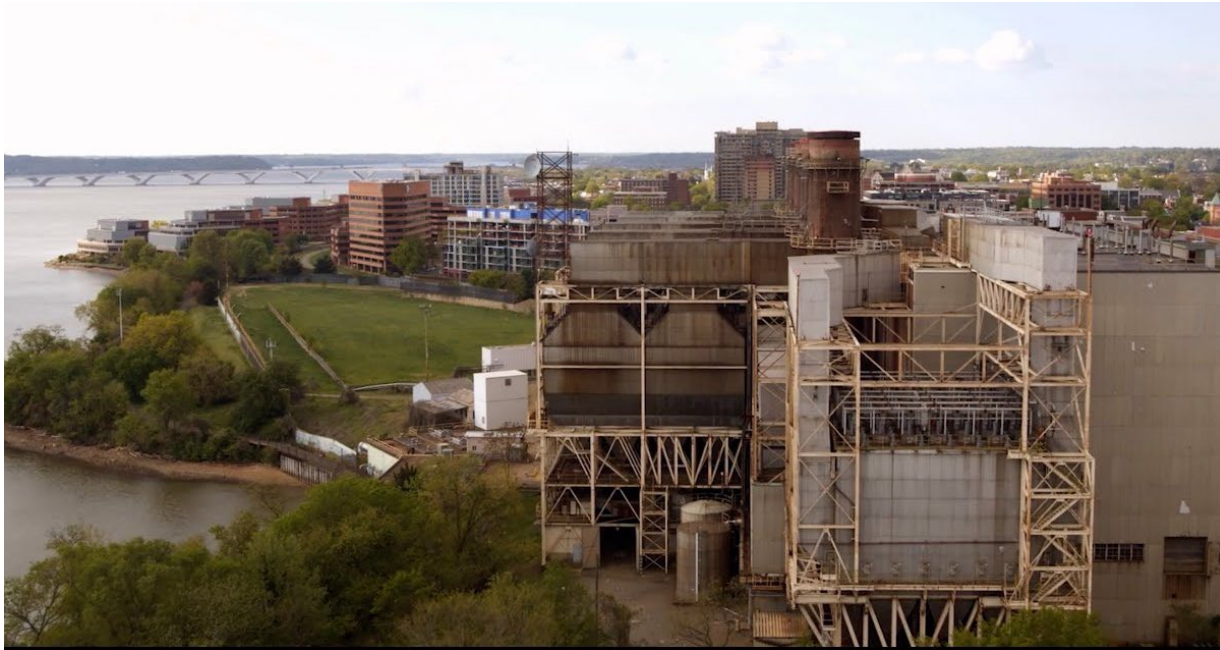
Estación generadora del río Potomac, Old Town North

Los Distritos de desarrollo coordinado (Coordinated Development District, CDD) establecen la zonificación para grandes extensiones de tierras planificadas para la reurbanización. El propósito de esta iniciativa es garantizar que la creación de viviendas asequibles se apoye en cada CDD nuevo. El reciente CDD para el sitio de la Estación generadora del río Potomac es un modelo que el personal examinará para una posible aplicación en CDD futuros.