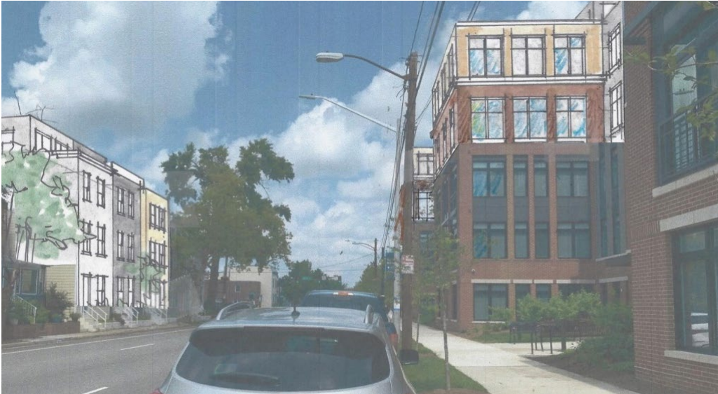
Representación visual de la “altura de bonificación”.

Esta iniciativa incentivaría un mayor uso de la Sección 7-703 de la ordenanza de zonificación que permite una altura adicional en nuevos proyectos residenciales a cambio de viviendas asequibles. La ley actual permite que la disposición se utilice en áreas con un límite de altura superior a 50 pies, y la propuesta permitirá que se utilice en áreas con límites de altura de 45 pies o más. Un objetivo de la iniciativa es expandir las opciones de vivienda y la dispersión en más áreas de la ciudad de una manera que sea armoniosa con el contexto físico circundante de la comunidad.