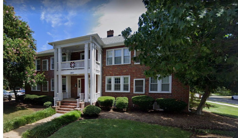
Condominios en Alexandria Square, Del Ray

El propósito de esta iniciativa es identificar patrones de uso de la tierra, como la combinación de usos y tipos de edificios que se encuentran en vecindarios históricos (Del Ray, Rosemont, Old Town y Parker-Gray) que ya no se pueden construir en virtud de la zonificación existente. Se identificarían características de patrones históricos de uso del suelo que son deseables junto con recomendaciones para cambios en la Ordenanza de zonificación para permitir que se consideren estos patrones.