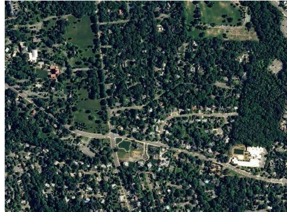
Un vecindario en Alexandria compuesto por viviendas unifamiliares independientes